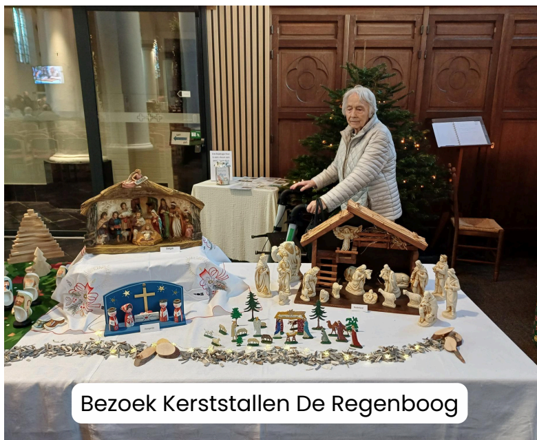
Bezoek Kerststallen De Regenboog