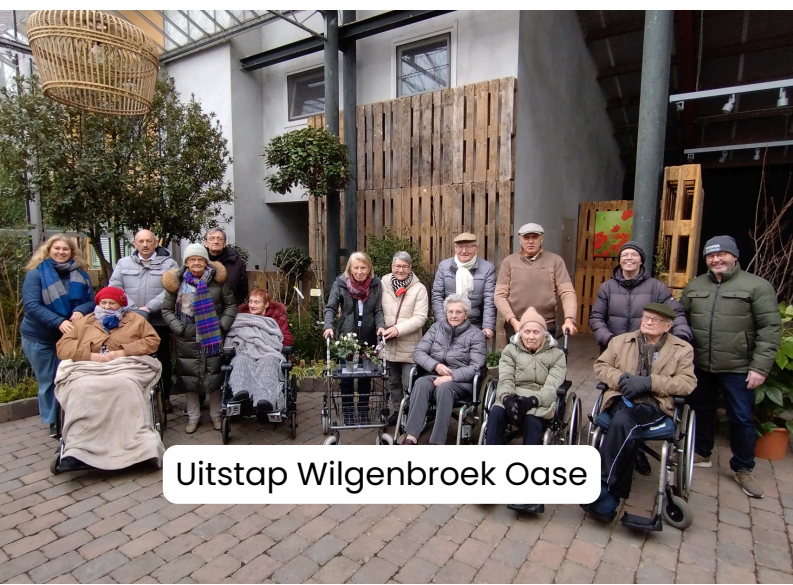
Uitstap Wilgenbroek Oase