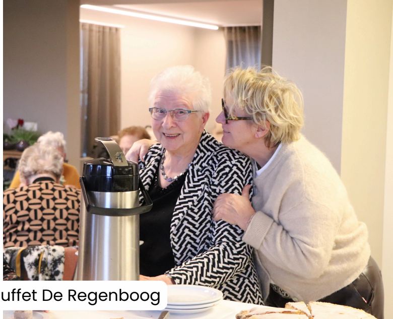
Dessertbuffet De Regenboog