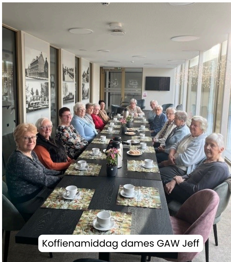
Koffienamiddag dames GAW Jeff