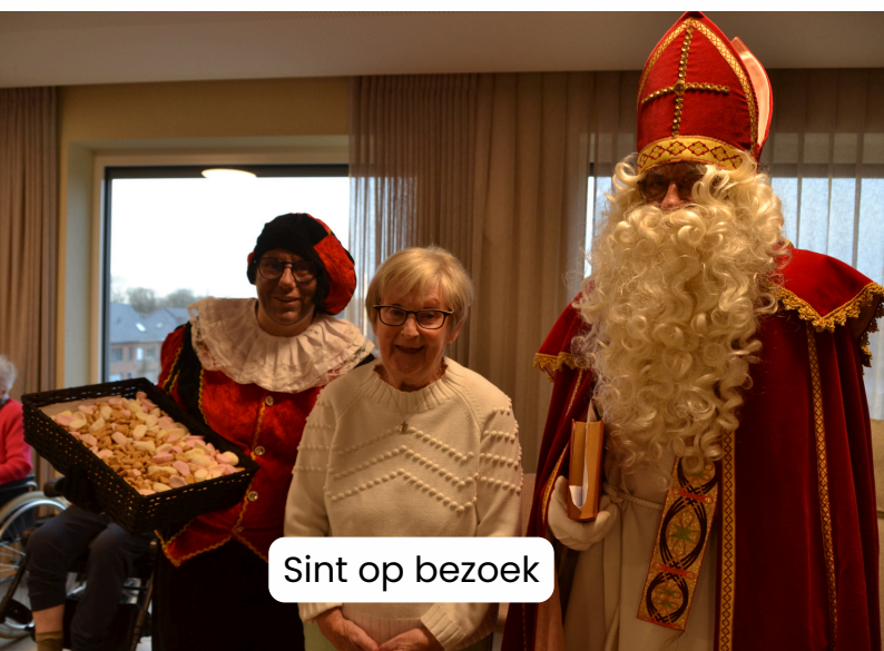
Sint op bezoek