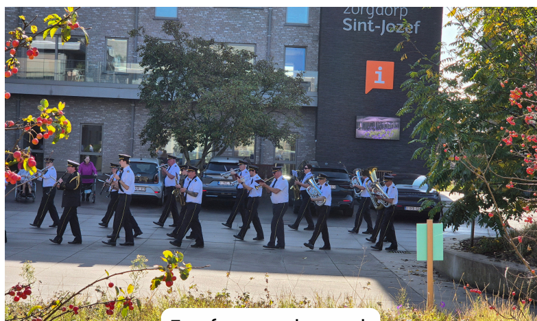
Fanfare op bezoek

WWW.WZCSTJOZEF.BE/NL/FOTOBOEK LOGIN: SINTJOZEF2024