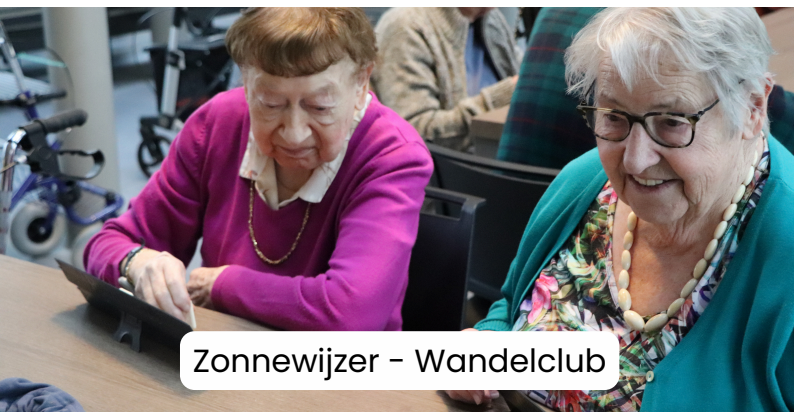
Zonnewijzer - Wandelclub