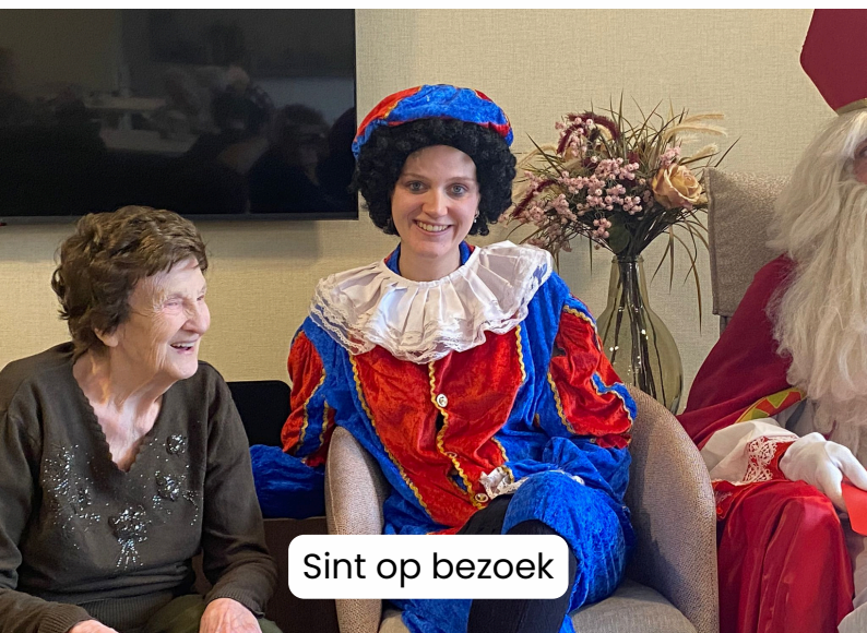
Sint op bezoek