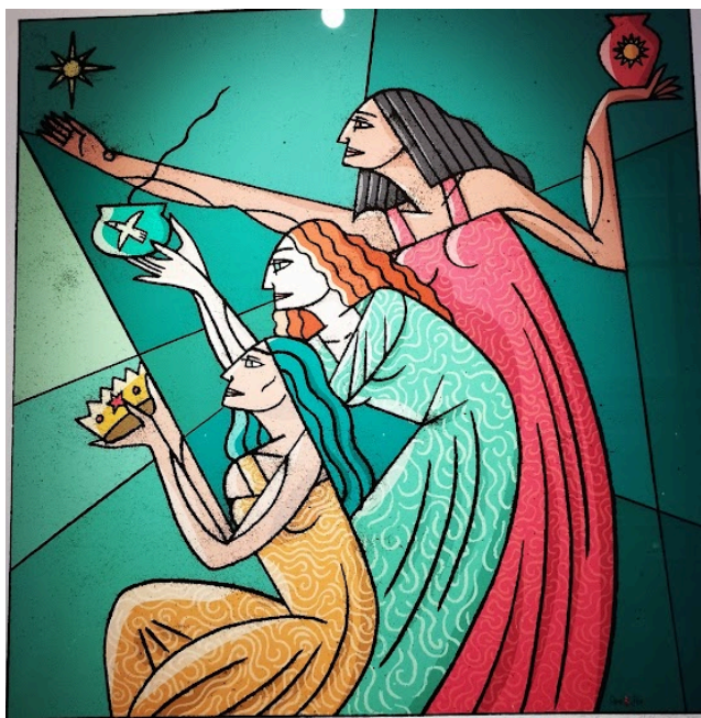
Titel: drie koninginnen