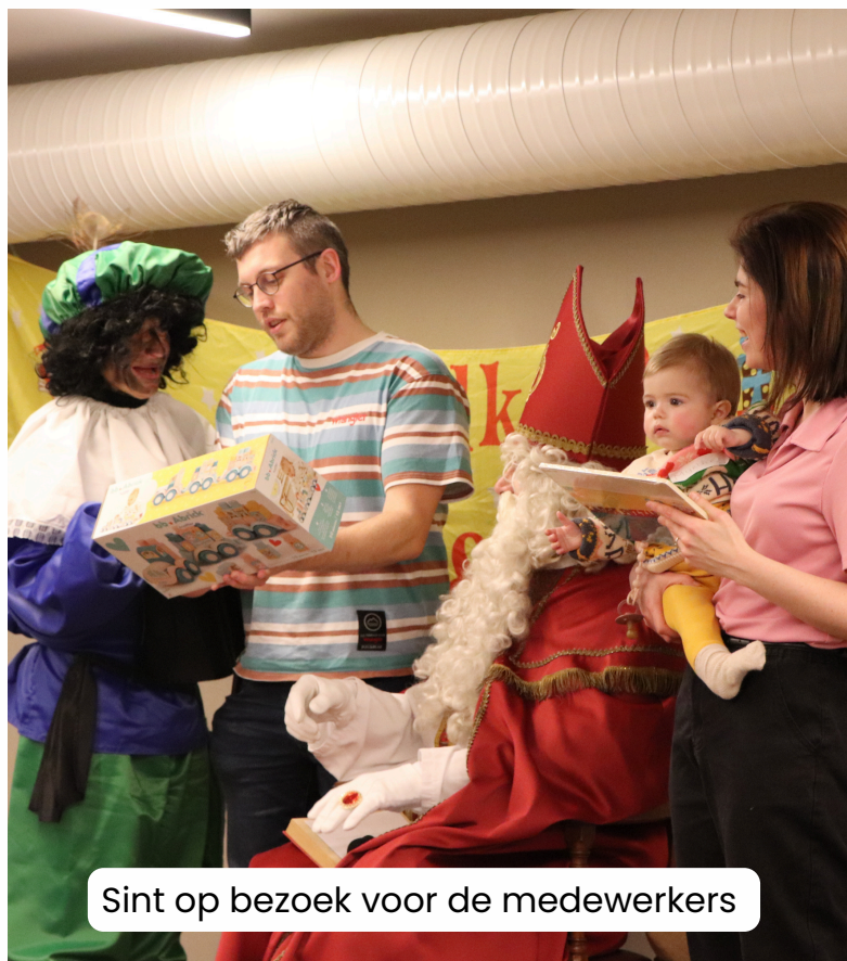
Sint op bezoek voor de medewerkers